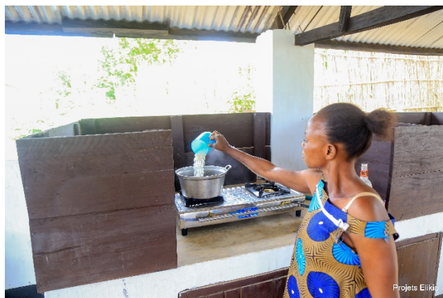
Du charbon de bois à la cuisinière à biogaz