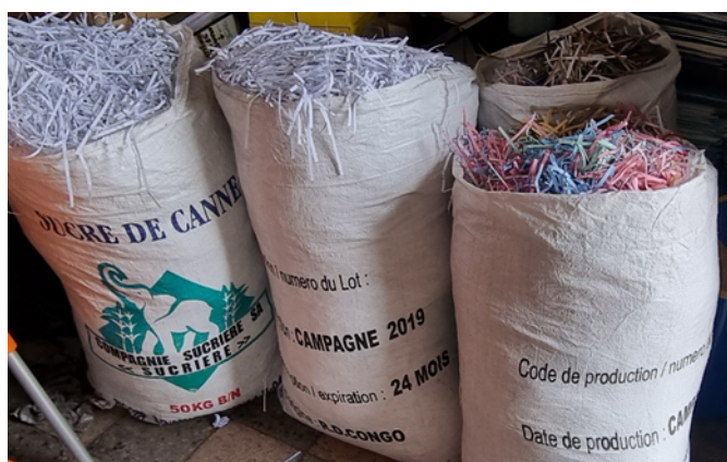
Récupération de papiers usés pour la création d'une œuvre d'art