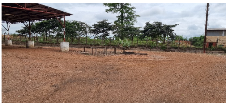
Journée de nettoyage dans les espaces du Magasin Produits Finis (Avant nettoyage Vs Après Nettoyage)