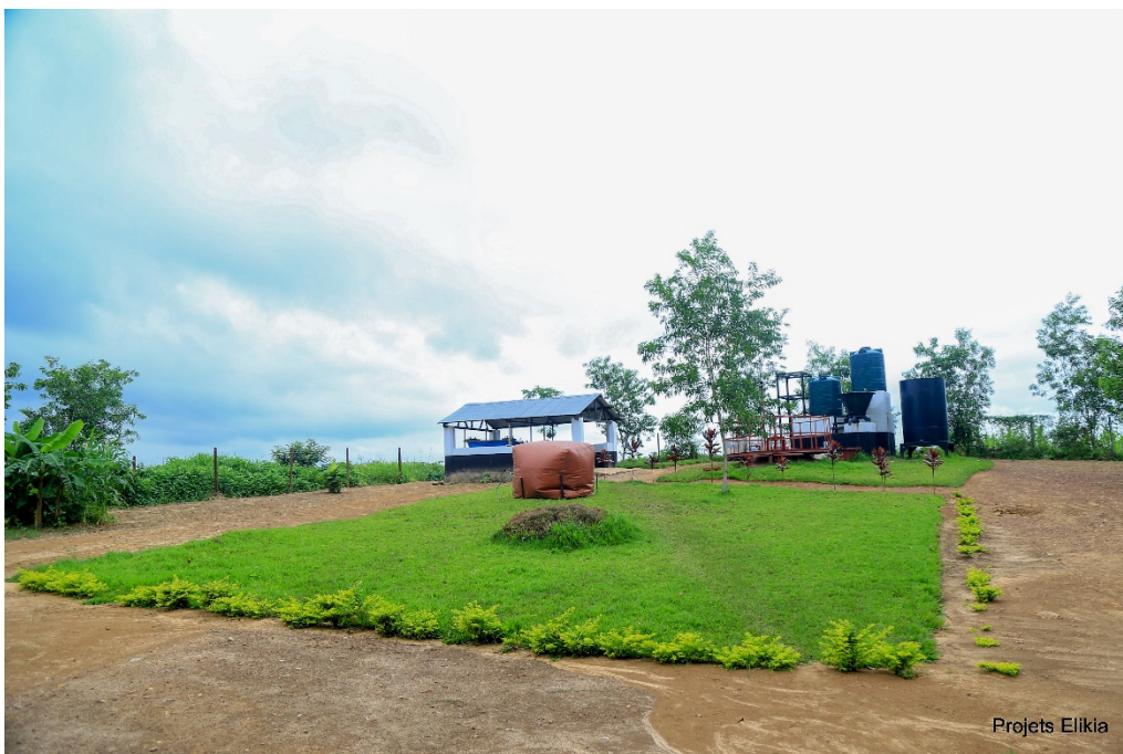
Site de production de biogaz au poste 4B

L'installation des toilettes sèches permet de limiter la propagation des maladies, tandis que les déchets sont par la suite valorisés via un processus de compostage et de méthanisation qui aboutit à une production de biogaz.