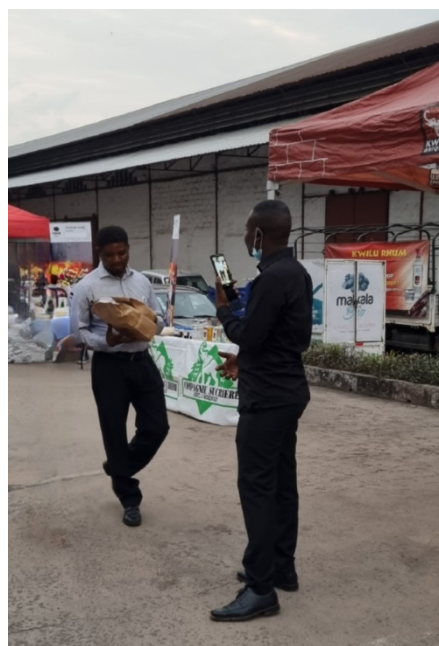
Remise de Makala Bio à un client de la Sucrière